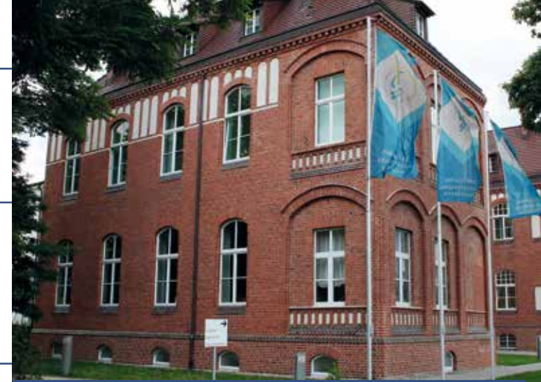
Asklepios Fachklinikum Brandenburg

Klinik für Psychiatrie, Psychosomatik und Psychotherapie