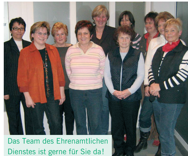
Das Team des Ehrenamtlichen Dienstes ist gerne für Sie da!

Alles, was wir für Sie erledigen, unterliegt der Schweigepflicht und wird vertraulich behandelt.