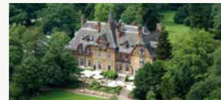
Villa Rothschild Kempinski

Falkenstein Grand Kempinski Debusweg 6-18 61462 Königstein/Falkenstein im Taunus